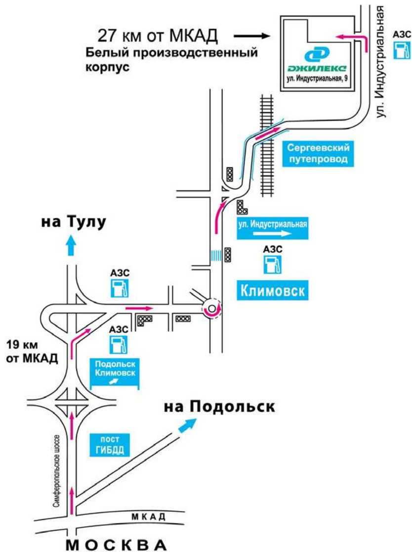
СХЕМА ПРОЕЗДА ОТ МОСКВЫ

Завод изготовитель. Сервисный центр Зал оптово-розничной торговли